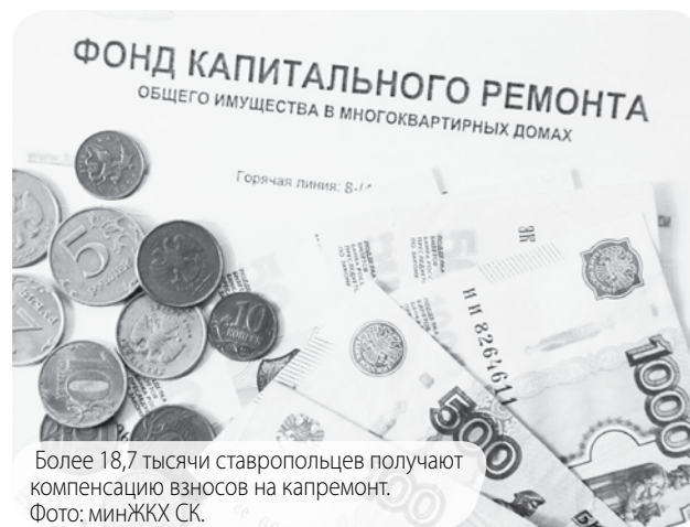
Более 18,7 тысячи ставропольцев получают компенсацию взносов на капремонт.

На получение компенсации в размере 50 и 100% имеют право собственники квартир – одиноко проживающие неработающие граждане в возрасте от 70 лет, а также