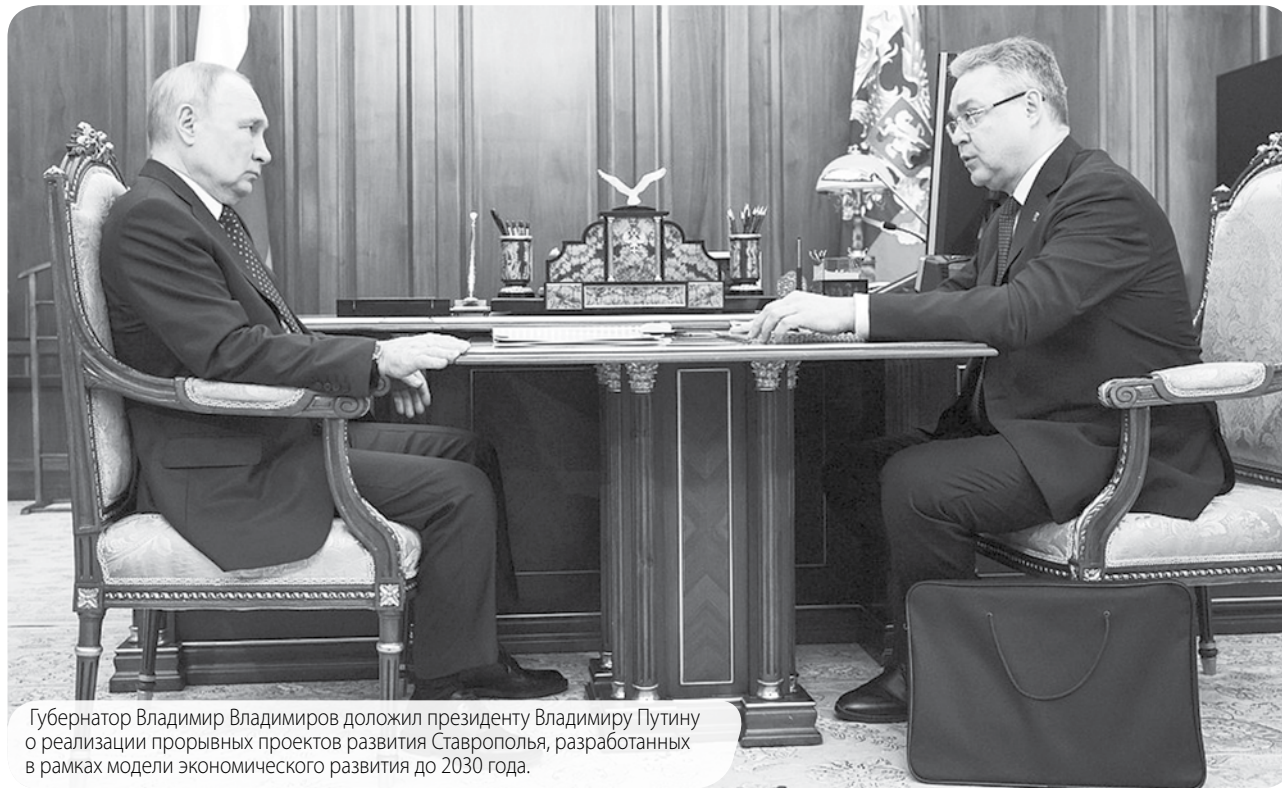
Губернатор Владимир Владимиров доложил президенту Владимиру Путину о реализации прорывных проектов развития Ставрополья, разработанных в рамках модели экономического развития до 2030 года.

В Москве состоялась рабочая встреча Владимира Путина с губернатором края Владимиром Владимировым.