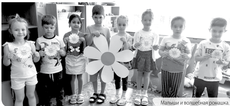
Малыши и волшебная ромашка.

Дети с большим интересом слушали рассказ воспитателя, смотрели мультфильмы, презентации, задавали вопросы, рисовали, отгадывали загадки, принимали участие в конкурсах «Семейные обязанности», «Вкусные вопросы», «Продолжите пословицы и поговорки», «Собери ромашку».