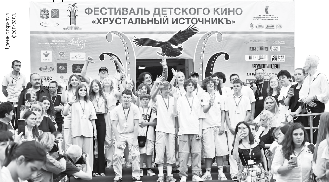
В день открытия фестиваля.